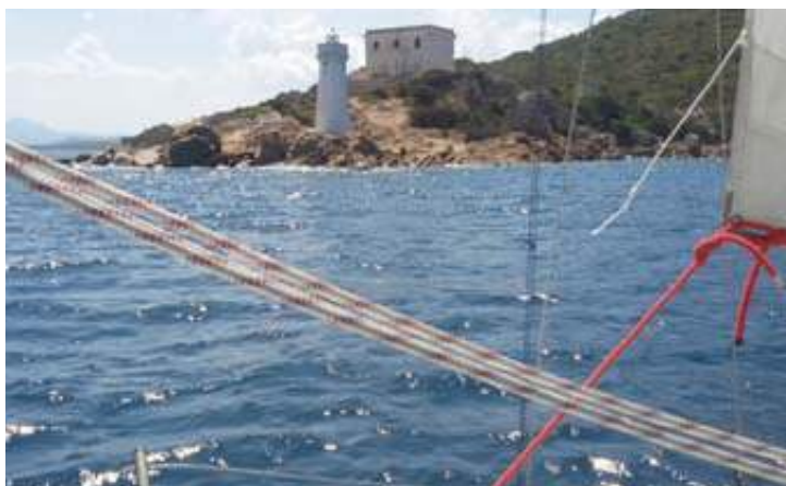
In vista di Capo d'Orso

Sosta a Cala Gavetta a Maddalena e quindi la sera ingresso a dir poco emozio-