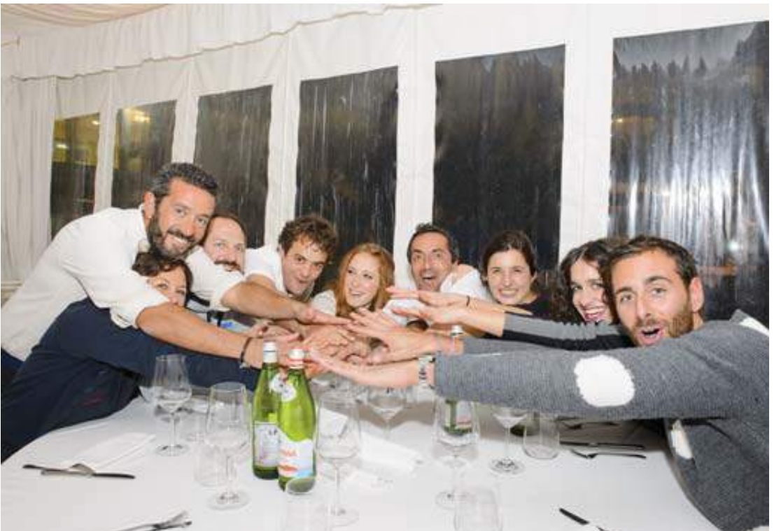
Sotto: equipaggio durante la cena