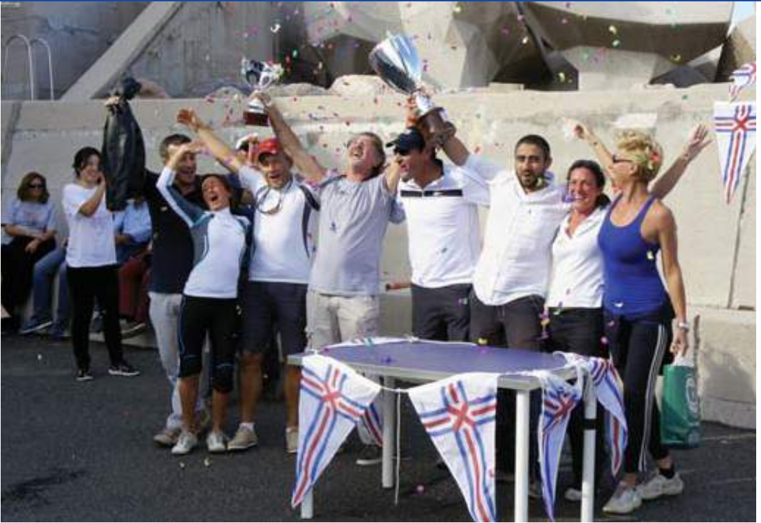
Sopra: equipaggio vincitore