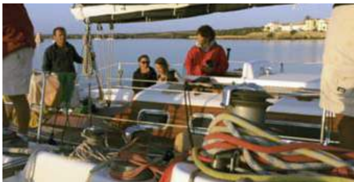
La Mouche dopo il salvataggio, al sicuro nel porto di Stintino

Il soccorso, da parte di un equipaggio del corso d'altura, di una barca francese che stava andando alla deriva