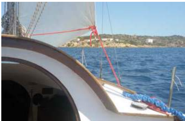
Ecco il CVC!