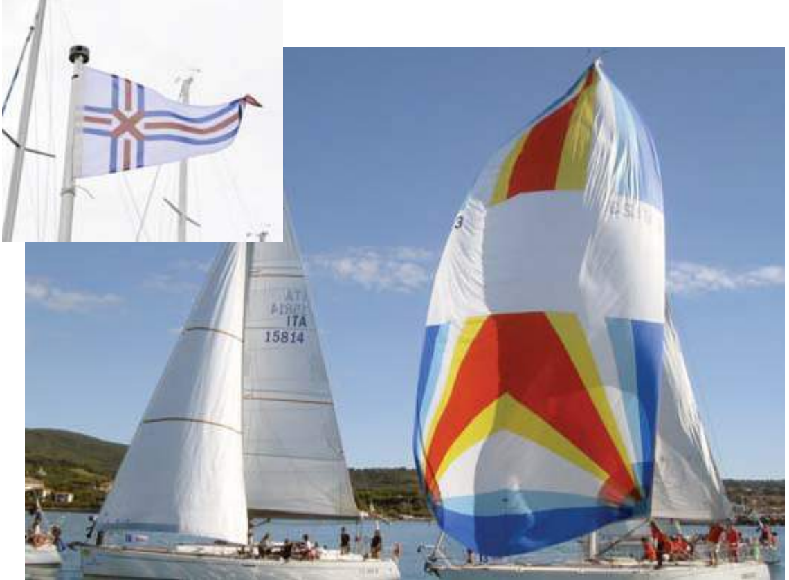
Momenti della veleggiata

PER IL 43° APPUNTAMENTO SIAMO TORNATI A CALA DE' MEDICI