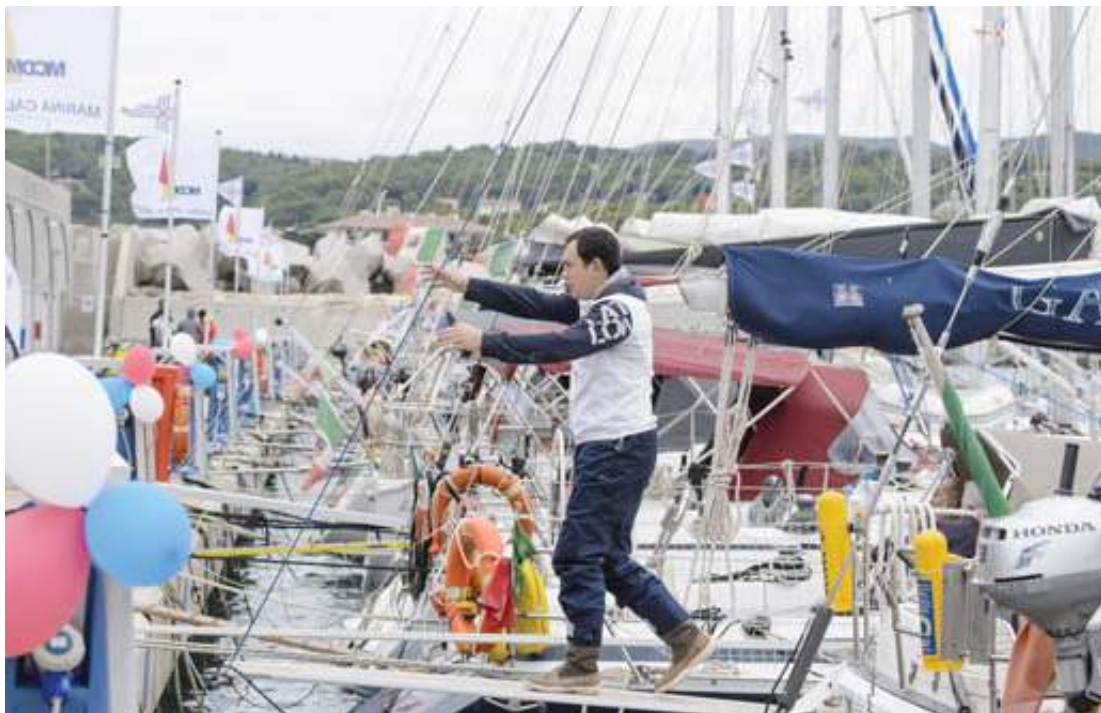
Tutti ormeggiati in banchina