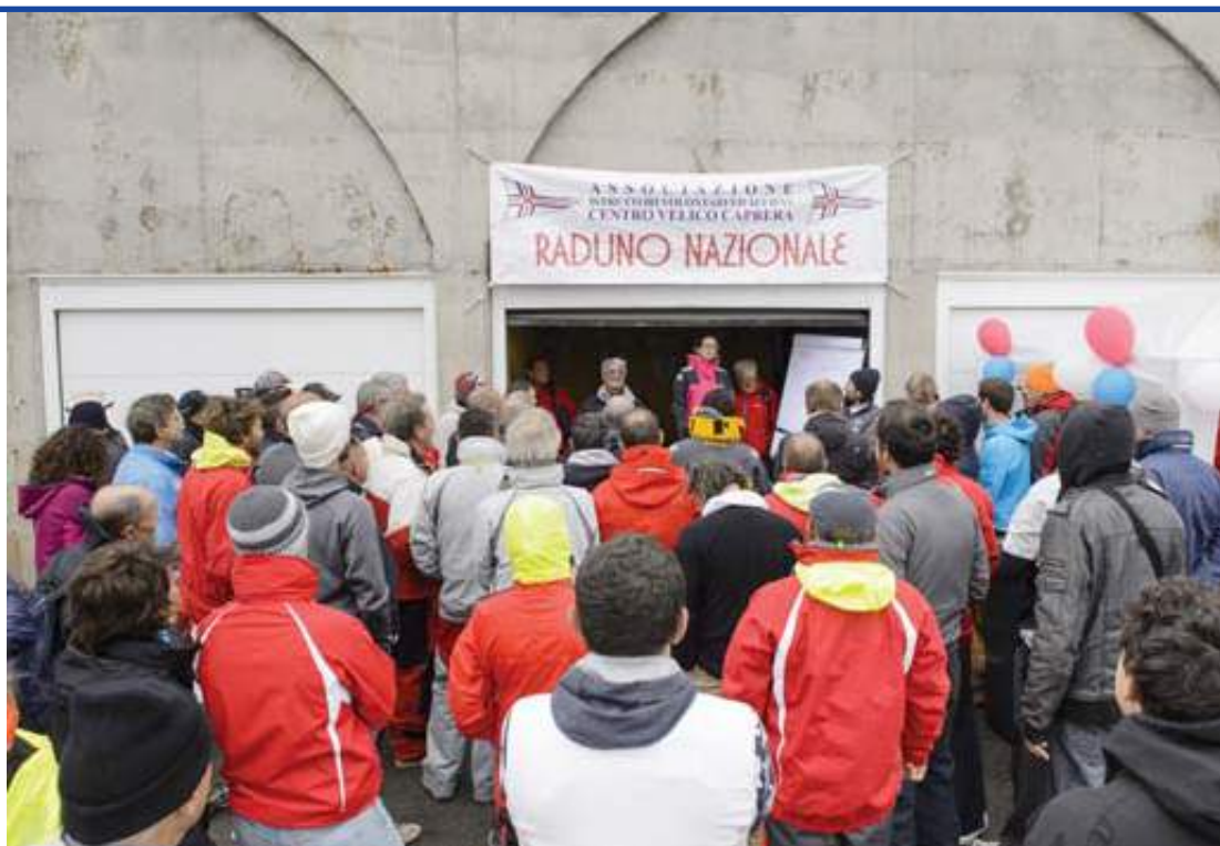
Equipaggi durante il briefing