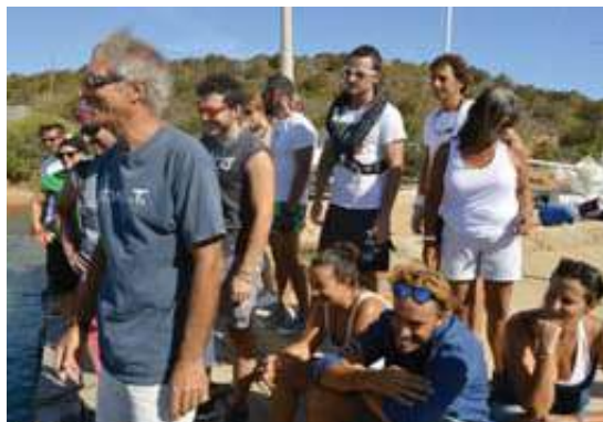
Allievi in adorazione del Topinambur