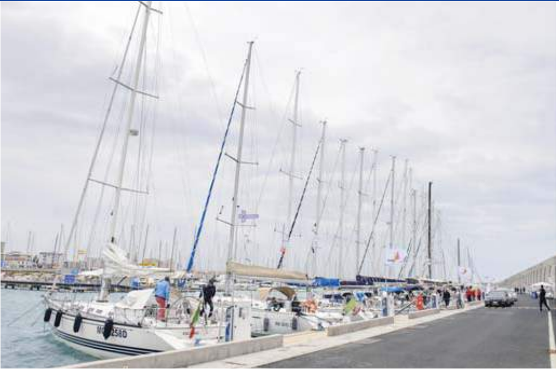
Banchina di Cala de' Medici