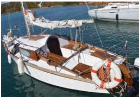
Al pontile del precrociera

di un Caravelle) da far provare ai giovani allievi per mantenere viva la storia del CVC: conoscere come eravamo per capire dove vogliamo andare e cosa vogliamo essere.