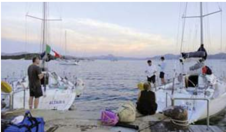
Altair II e Rigel II all'arrivo a Caprera