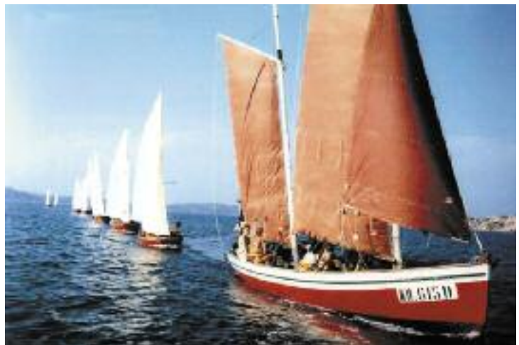
Anni '70: caravelles in linea di fila guidata dal "Diotifulmini", il lancione regalato dalla Marina Militare