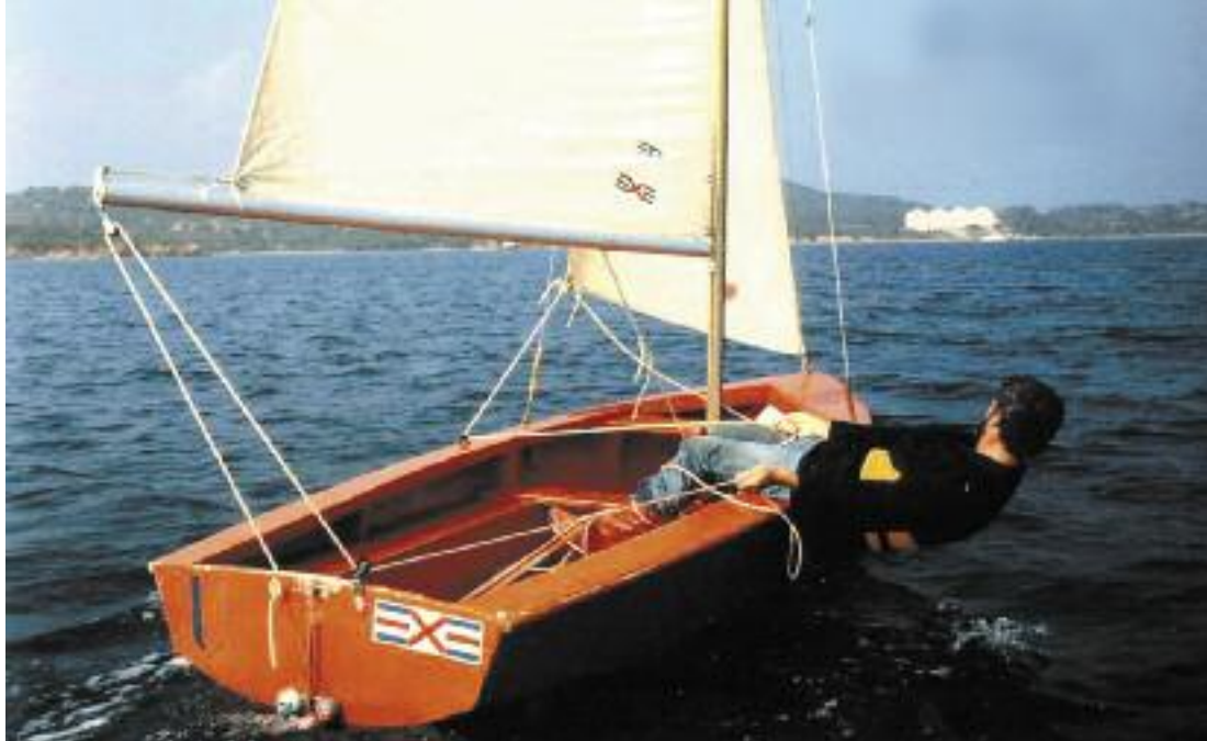
Vaurien a Porto Palma