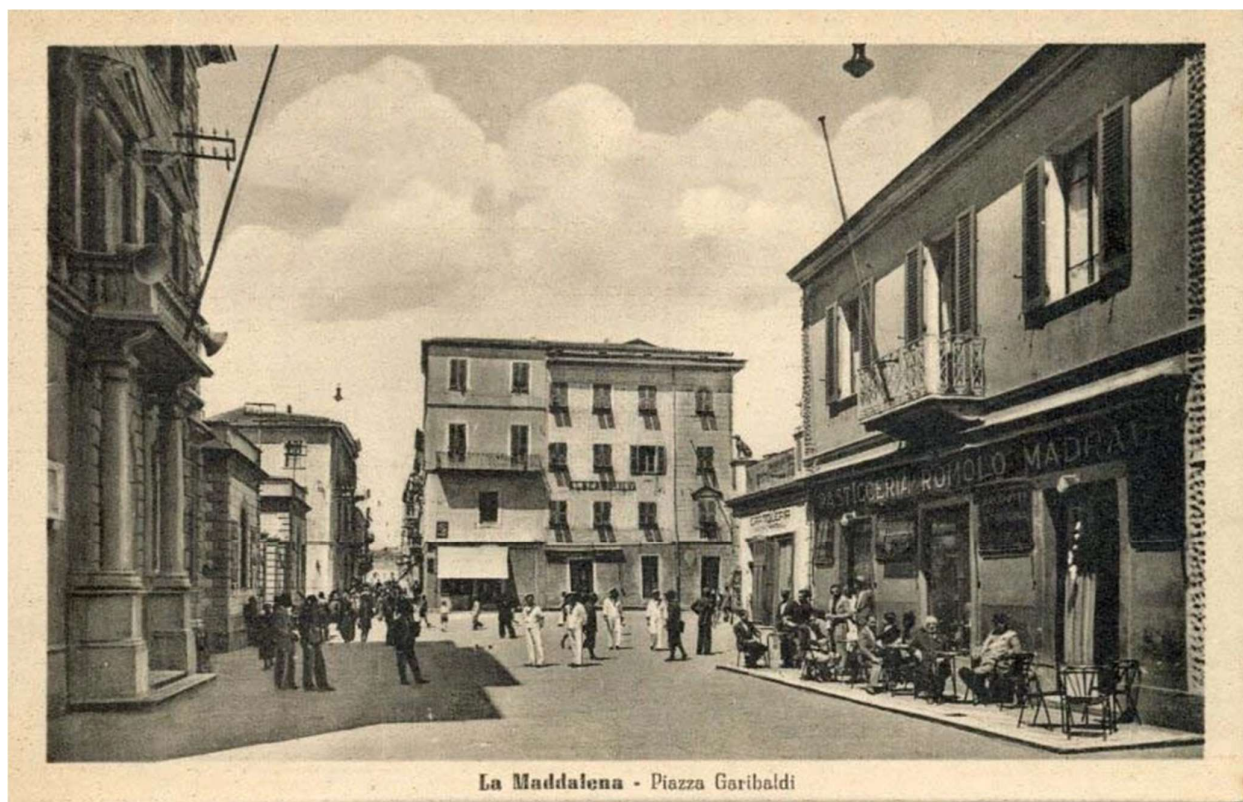
Cartolina storica. Ovviamente assente la statua bronzea di Garibaldi seduto, inaugurata nel 2011.

La Maddalena abitanti 8550 - Albergo Belvedere, modesto, ed altri. Servizi di barche a vela e motoscafi per il Palau, pag. 226. Alcune vetture stazionano ordinariamente in piazza del Comando, per la casa di Garibaldi (in 40 minuti, km. 5,5, andata e ritorno L. 3-5 compresa fermata di 1 ora). Gli ufficiali di passaggio possono alloggiare alla Foresteria annessa al Circolo Ufficiali, con pagamento di tenue quota, e prendere i pasti alla mensa del Circolo.