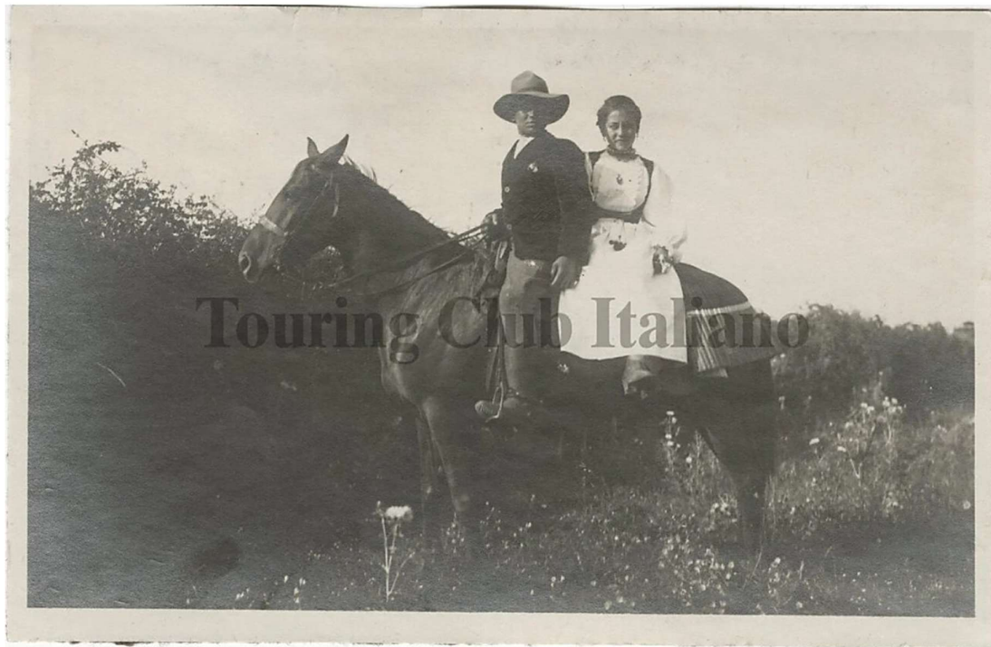
Sardegna, coppia a cavallo, 1921

A rigore quindi da Civitavecchia bastano un giorno e due notti per l'escursione di Caprera. Al turista che fa il viaggio di Sardegna, se il tempo è bello, conviene approfittare di questa circostanza all'arrivo a Golfo Aranci, per esaurire subito l'escursione in buone condizioni, che forse non troverebbe al ritorno. L'escursione riesce fastidiosa, a chi soffre il mal di mare, coi venti di tramontana, levante e scirocco.