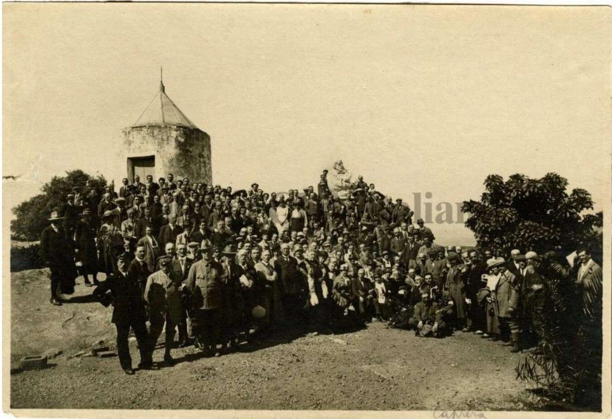
Escursione TCI a Caprera, maggio 1921

Entrando a sinistra in un cancello ove il corpo di guardia si trova un ampio e ridente cortile. Di fronte un po' verso destra la strada fiorita che conduce alla Tomba. A sinistra, il giardino di Garibaldi e la Casa. Sull'origine del soggiorno di Garibaldi a Caprera si hanno notizie diverse. Sembra che Garibaldi sia avvenuto la prima volta alla Maddalena nell'ottobre del 1849. Quando, dopo la gloriosa difesa di Roma, fu esiliato dal Governo Sardo e quivi tenuto prigioniero pochi giorni, prima di essere condotto a Tangeri, da dove l'Eroe passò poi in America.