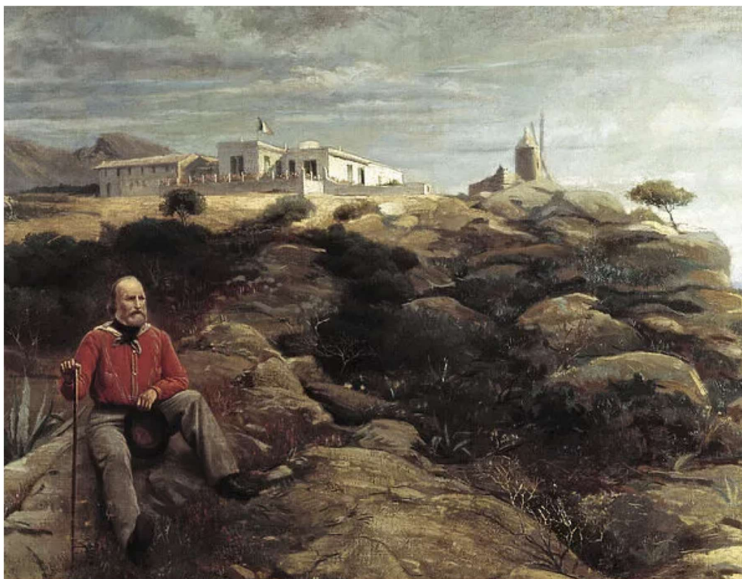
Giuseppe Garibaldi a Caprera. Giacomo Mantegazza , 1867 Milano, Palazzo del Risorgimento