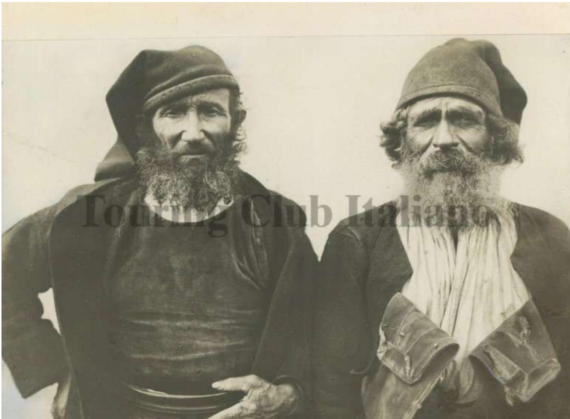
Pastori sardi in costume regionale, 1910

Si costeggia, a piccolissima distanza, per km. 1.5, in acque molto profonde, l'imponente muraglione granitico di Capo Figari, quasi a picco sul mare, scavato da profonde grotte, con le sommità ricoperte di alberi nani e di pini, sulle quali non è raro scorgere dei mufloni, numerosissimi su queste balze, essendo tutta la penisola di Capo Figari caccia riservata.