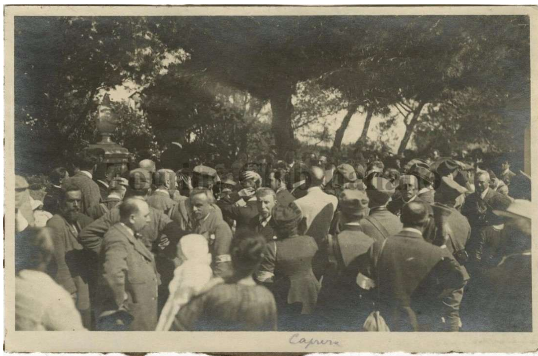
Escursione TCI a Caprera, visita alla tomba di Garibaldi, maggio 1921

Visita a Caprera. Dalla piazza del Comando fino alla Casa di Garibaldi , vettura, vedi sopra. La Tomba e la Casa sono sotto sorveglianza del Comando, che vi tiene una guardia d'onore agli ordini di un sott'ufficiale di Marina. Proibito fotografare, salvo permesso scritto del Comando. Orario di visita della Tomba, in generale dalle 9 alle 14 tutti i giorni: alla Casa, trasformata in museo, stesse ore salvo il venerdì. L'orario è però alquanto variabile: in certi giorni l'accesso è anche inibito, salvo permesso, che facilmente si accorda, dal Comando.