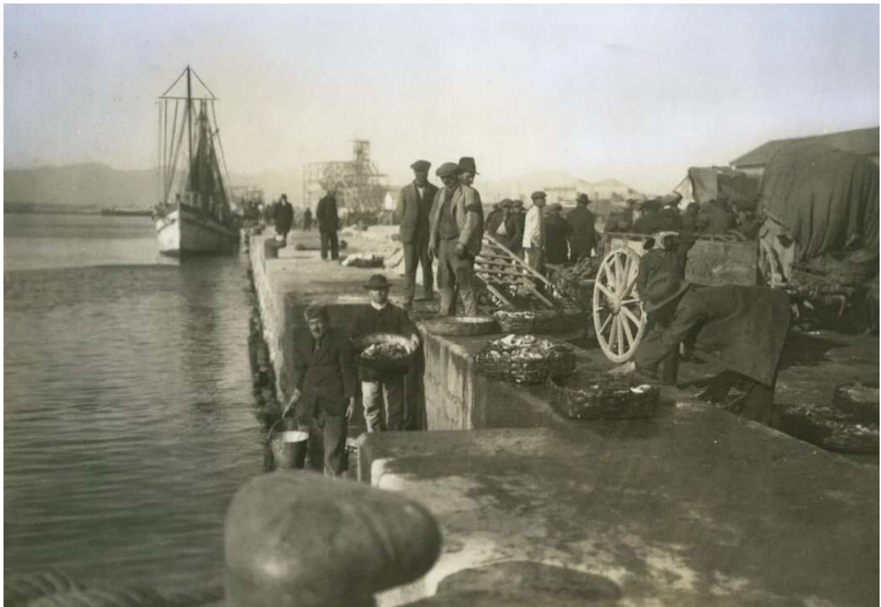
Pesca in Sardegna, 1920

Lasciando Golfo Aranci (pag. 73) si gira il molo e lungo terra, a Nord del vasto Golfo di Terranova 2 , con splendida vista da ogni parte, si punta verso l'isola di Tavolara, pag. 234, che giustifica di qui perfettamente il suo nome. La lunga linea della sua piatta cresta, che cade dirupata in mare, si stende per quasi 5 km all'altezza di circa 500 m. La punta del Passo Malo, nel centro, tocca i 561.